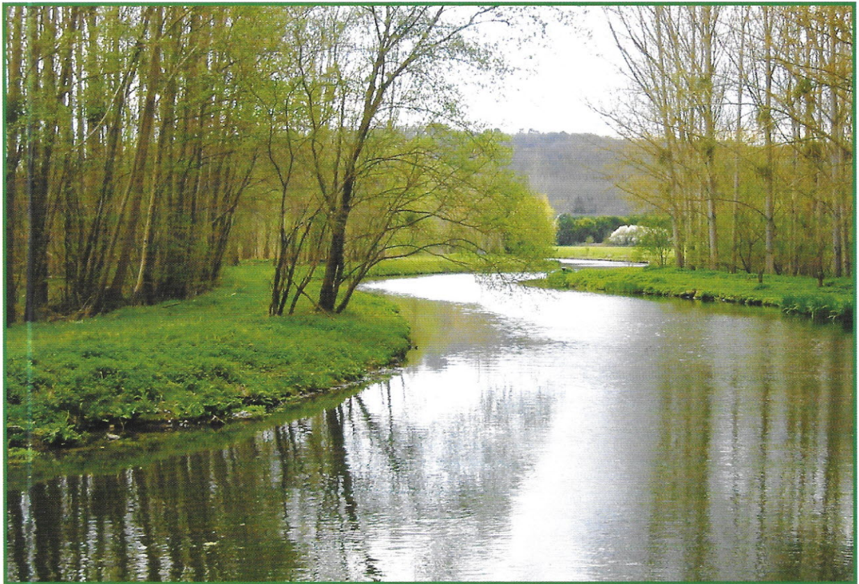
La rivière Juine, prairie de Vaux